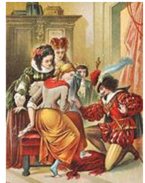
Sans-drillion vosgienne et allemande (Epinal et Aschenputtel, XIX ème siècle)

"MAdelEd, regarde ce que je t'apporte ! une superbe robe empruntée aux GaLaf ! ainsi tu iras au bal !"