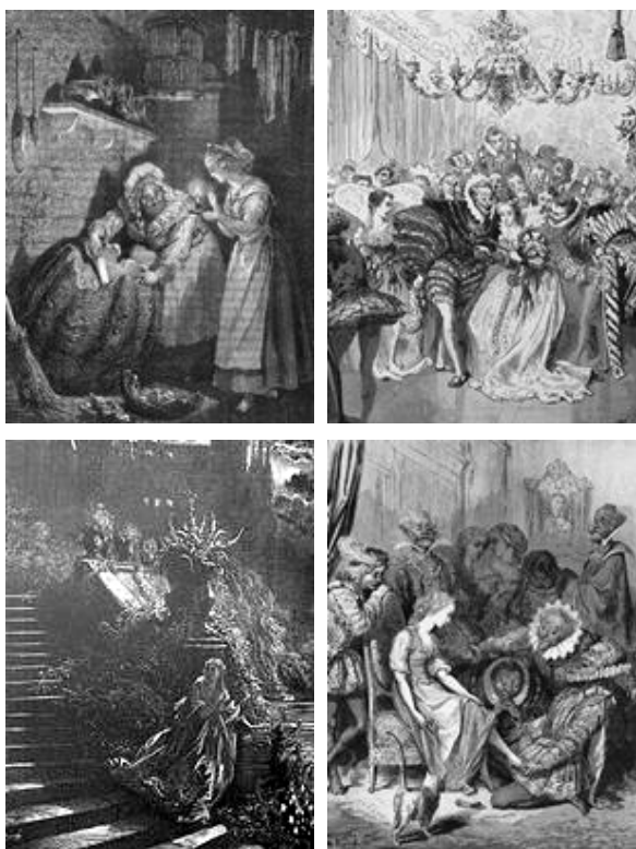
Gravures de Gustave d'Auray (Bretagne, 1869)

Pris d'une ardeur soudaine pour le service du Seigneur, Christophe envoya donc deux de ses officiers les plus dignes de confiance, seulement armés de la pantoufle, fouiller le pays en quête d'un pied capable de la chausser.