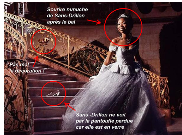
Brandy Norwood dans Cinderella (1997)

Les femmes n'ont-elles point de tête, ou voient-elles plus loin que les hommes ne le pensent ? toujours est-il que Sans-Drillion perdit une pantoufle dans sa hâte et dans l'escalier, tandis que Jules actionnait avec une vigueur désespérée la corne de la jague. Ensuite de quoi il employa toute sa diligence à ce qu'ils arrivassent à peu près à temps pour que Sans-Drillion se changeât en souillon, bien que sa tête restât encore emplie d'étoiles, et que sa marraine eût seulement à déclarer le vol d'une paire de pantoufles.