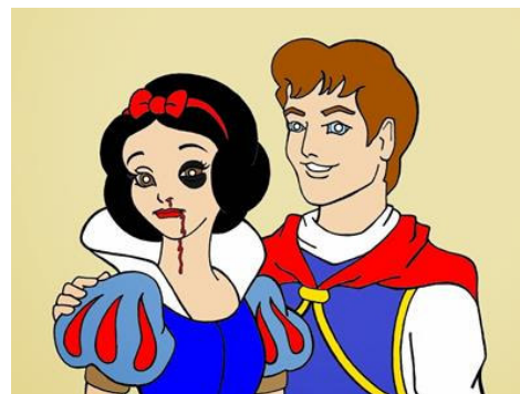
Sans-Drillion femme battue