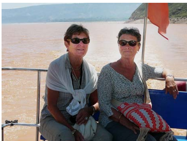
Le Fleuve Jaune porte bien son nom...

Complexe, immense, peu accessible car très montagneuse, la Chine est souvent incompréhensible pour les occidentaux. Pays-continent, elle a derrière elle plus de deux millénaires en tant qu'État organisé et près de quatre sur le plan culturel. Ses enseignements majeurs sont ceux de Confucius (Maître Kong), de Laozi (Lao Tseu et le taoïsme) et d'une forme sinisée du bouddhisme (Fo). Ils diffèrent à la base des valeurs occidentales selon lesquelles "le sage doit se garder de vouloir en même temps une chose et son contraire", selon Aristote notamment. La culture chinoise aime associer des contraires qui deviennent en fait des compléments. Le Yin et le Yang en sont l'exemple emblématique.