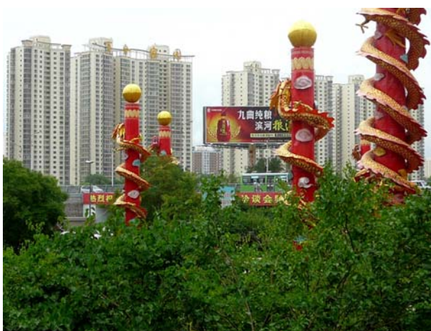
Lanzhou, capitale de la province du Gansu, sur le Fleuve Jaune. Les maisons traditionnelles à cour ont disparu au profit de grands immeubles et de parcs paysagers décorés "d'œuvres d'art".