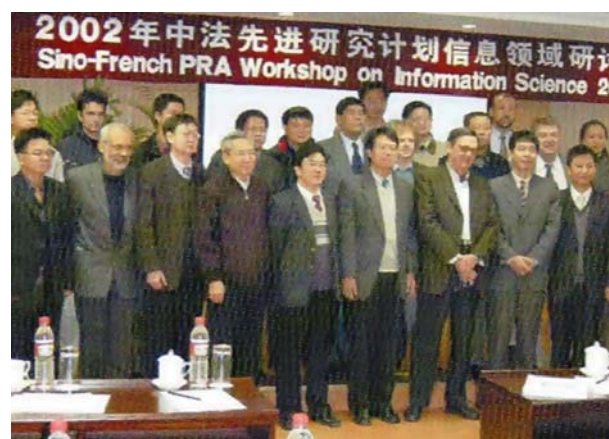
Chercheurs chinois et français lors du workshop sur les Sciences de l'Information (2002)