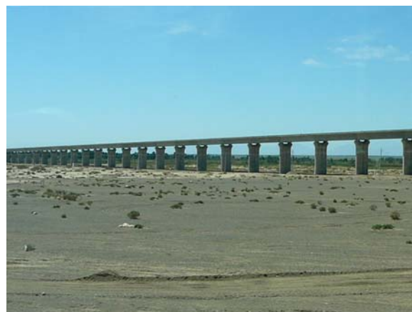
Une réalisation exceptionnelle : la ligne TGV traversant le Désert de Gobi

J'ai été éjecté de la photo. Ce fait relevait d'une autre époque : sans voitures et avec des multitudes de vélos. Il ne se produirait plus aujourd'hui que dans les campagnes reculées maintenues non modernisées comme réservoir de main d'oeuvre