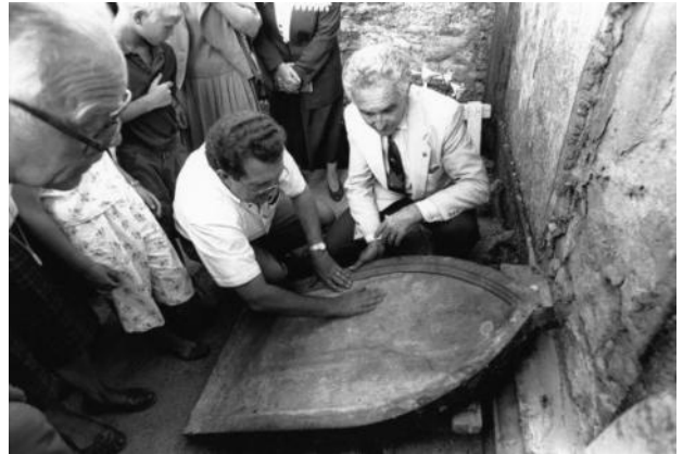
Ouverture de la tombe présumée de Louis XVII au Cimetière de Gleizé, Rhône (10 août 1990)

bien ceux de Louis Capet, fils de Louis XVI. Ainsi, cette énigme de plus de deux siècles n'en est plus une.