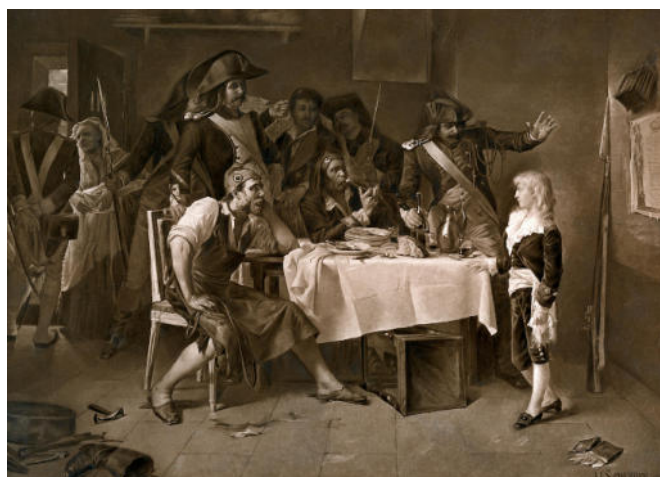
Louis XVII lors de l'arrestation de la Famille Royale à Varennes, 20/21 juin 1791

L'enfant du temple était le Petit prince Louis XVII, le fils de Louis XVI. Il fut incarcéré dans la prison du temple à partir de 1792 à l'âge de 7 ans jusqu'à son décès le 8 juin 1795 dans des conditions obscures.