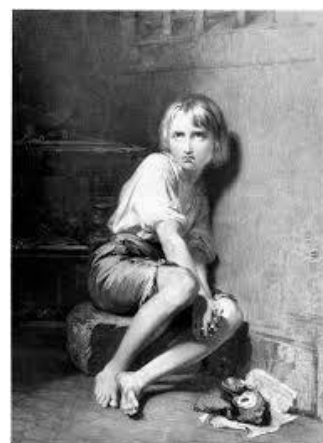
Le petit Louis XVII avant son incarcération en 1793 et le même enfant peu avant sa mort présumée en 1795. S'agit-il du même enfant ou a-t-il été substitué par un autre ?

Quelques jours plus tard, le Professeur succombait à des troubles que ses élèves qui l'autopsièrent, comme Bichat et Dupuytren, attribuèrent à une infection provoquant beaucoup de fièvre, et donc assortie de périodes de délires violents.