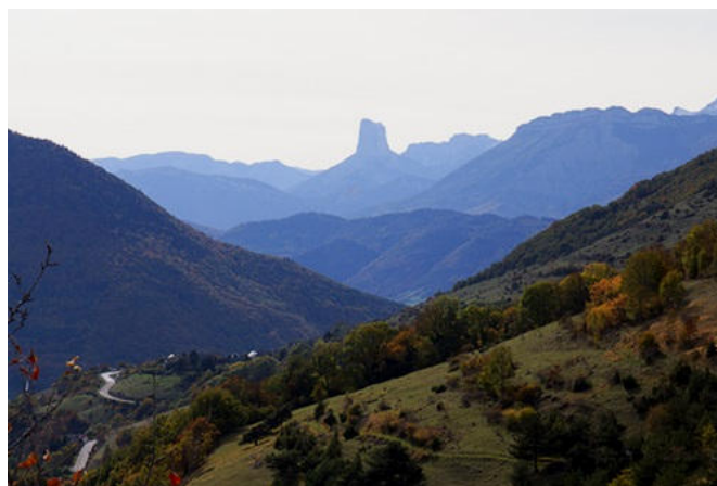
Le Mont Aiguille vu de la route depuis Grenoble vers la Mure, probablement suivie par Charles VIII

Il y avait donc un double obstacle à surmonter, à la fois physique et psychologique pour un homme proche de la cinquantaine (A. Beau, qui ne cite pas ses sources, le fait naître vers 1445).