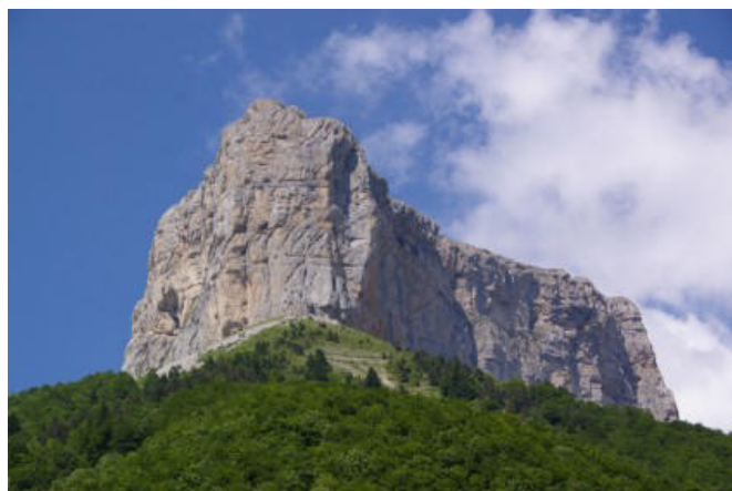
Le Mont Aiguille Face Sud (Photo-Dauphiné 2020)

L'ascension eut lieu le 26 juin 1492. On sait qu'Antoine de Ville était accompagné de son laquais Guillaume Sauvage, de Sébastien de Carret (ou de Carrect), maître royal en théologie, prédicateur apostolique, de "l'escalleur" du Roi, du nom de Reynaud, de Cathelin Servet, maître tailleur de pierres de l'église Sainte-Croix de Montélimar, de Pierre Arnaud, maître charpentier à Montélimar, de Jean Lobret, habitant de