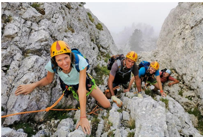
La voie normale

Il est également très probable que ce groupe était accompagné de plusieurs porteurs, peut-être des hommes d'armes placés sous le commandement de Domjulien. En effet, on imagine mal ces quelques personnes transportant le matériel d'escalade, sans doute important, avec ses "subtils engins" et ses échelles, ainsi que les vivres destinés au séjour sur le sommet. Car on sait qu'ils y restèrent plus d'une semaine. Dans une lettre au président du Parlement de Grenoble, écrite sur le sommet le 28 juin, Antoine de Ville déclare : " Quand je party du roy, il me chargea faire essayer se on pourroi monter en la montaigne que on disoit inascensibilis dont par de sobtils angins j'ay fait trouver la fasson de y monter " (6).