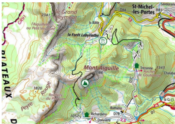
Le tracé de la randonnée Tour du Mont Aiguille qui part de Richardière et passe par Trézanne est figurée sur cette carte.