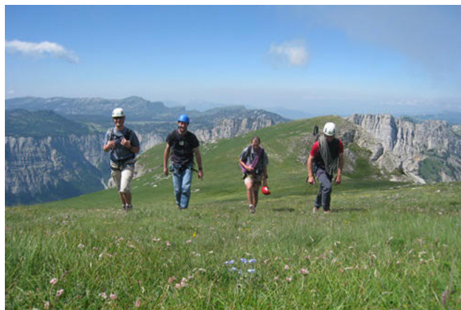
Alpinistes sur la prairie sommitale

Grenoble, repris par François de Bosco dans son témoignage, qui fait état d'une longueur d'échelles d'une demi-lieue, ce qui représente environ 2 000 mètres. C'est beaucoup pour gravir une falaise qui fait, au plus, 350 mètres de haut ! On est donc tenté de faire l'hypothèse, à la suite de M. Renaudie (7), qu'Antoine de Ville aurait, par ailleurs, présenté au roi une note de frais quelque peu "gonflée", pratique qui aurait, déjà à l'époque, été en usage.