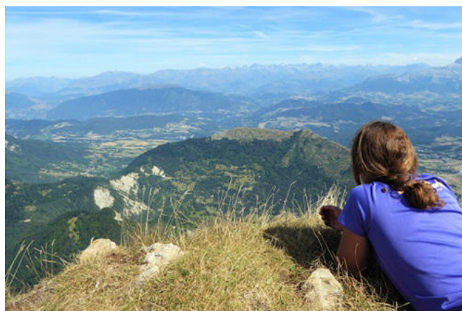
Vue du Sommet. Au fond, la chaîne de Belledone

L'exploit n'est pas passé inaperçu, si l'on en juge par les mentions qui en sont faites dans de nombreux écrits de l'époque. Et si les récits des vainqueurs et de ceux qui leur ont rendu visite sont d'une grande sobriété, ceux de leurs épigones sont nettement plus fantaisistes. On a ainsi parlé d'un bouquetin aux cornes d'or trouvé sur le sommet. Rabelais a lui aussi été frappé par l'évènement et en fait mention dans son Pantagruel (8), dans un texte malheureusement truffé d'erreurs : il donne à la montagne la forme d'un "potiron", c'est à dire d'un champignon dans le parler de Touraine, se fiant en cela à des gravures de l'époque qui la représentent plus large à son sommet qu'à sa base, et en attribue l'ascension à Doyac, artilleur au service de Charles VIII, ce qui la situerait en 1494. L'ennui est que ce texte célèbre a jeté le discrédit sur tout ce qui a été écrit à l'époque sur le