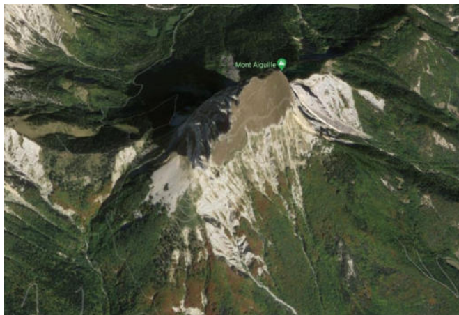
Vue satellite du Mont Aiguille (Google Maps)

Tout porte à penser qu'Antoine de Ville faisait partie de l'escorte du roi au cours de ce voyage. Le 6 novembre le roi est à Grenoble et deux jours plus tard des documents attestent de sa présence à Embrun. C'est au cours de ce voyage qu'il découvre le " Mons Inaccessibilis ", vraisemblablement le 7 novembre, et c'est probablement à cette occasion qu'il confie à Antoine de Ville la mission d'essayer de le gravir. On ne sait rien de l'itinéraire suivi, mais pour couvrir les 140 kms de routes de montagne en deux jours, il est vraisemblable que ce soit le chemin le plus direct qui ait été suivi. Il emprunte la rive droite du Drac, par N.D. de Commiers, la Mure et Gap. Cet itinéraire offre une vue superbe sur la chaîne du Vercors et, entre Monteynard et la Motte d'Aveillans, ce mont dit inaccessible et qu'à la suite d'Antoine de Ville on nomme maintenant le Mont Aiguille apparaît en majesté sur l'horizon, comme une tour de 350 mètres de haut qui se dresse, superbe, au sommet d'un cône d'éboulis.