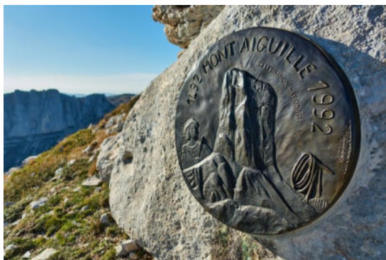
Plaque commémorative du Club Alpin Français

lettre au Parlement de Grenoble, Antoine de Ville emploie des termes qui correspondent plutôt à un souhait du souverain qu'à un ordre, et que même si cela était, l'exploit n'en serait pas moins grand. De fait, la majorité des spécialistes partagent le point de vue de Coolidge (1) pour dire que la première ascension du Mont Aiguille est le véritable point de départ de l'alpinisme moderne. C'est en particulier l'avis, autorisé entre tous, du Club Alpin Français qui, en 1933, a apposé sur la paroi de la montagne une plaque de bronze, portant une inscription latine qui se traduit ainsi : "En MCDXCII, Antoine de Ville, capitaine de Montélimar, inaugura l'alpinisme moderne en faisant, avec sept compagnons, sur l'ordre du roi Charles VIII, la première ascension de cette montagne alors dite inaccessible". Il confirma son intérêt par la pose d'un médaillon lors de la célébration du cinq-centième anniversaire de l'expédition.