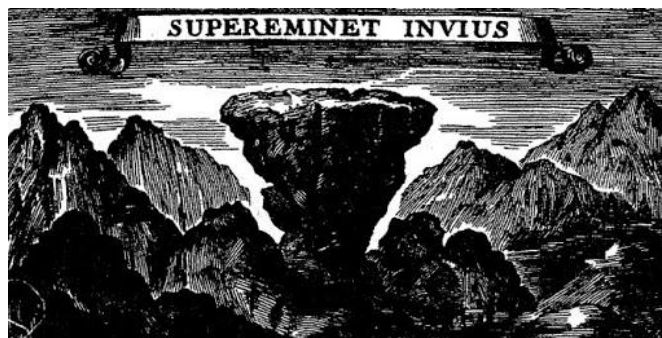
Croquis imaginaire du Mont Aiguille datant de 1701

"miracles" (merveilles) du Dauphiné, offert en 1701 à Louis XIV par le jésuite grenoblois Ménestrier, le Mont Aiguille est comparé au règne glorieux du Roi Soleil et la montagne est encore représentée comme une pyramide renversée avec cette devise : "Supereminet Inivius" . Ce n'est que deux ans plus tard que l'Académie des Sciences dut corriger cette erreur et préciser : "que cette montagne prétendue inaccessible qui est à 8 ou 9 lieues de Grenoble au midi, n'est qu'un rocher escarpé planté sur le haut d'une montagne ordinaire, et que même ce rocher n'a nulle figure de pyramide renversée" (11).