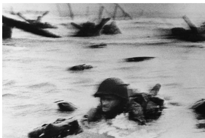
"Face in the Surf", Robert Capa, © Collection particulière

La première photo, intitulé "Face in the Surf" a été prise le 6 juin 1944 par Robert Capa (pseudonyme d'Endre Ernő Friedmann, 1913-1954), correspondant et photographe de guerre hongrois. Celui-ci a choisi d'être intégré dans la flotte de débarquement alliée en Normandie pour "couvrir" la première vague d'assaut à Omaha Beach, entre Colleville-sur-Mer et Vierville-sur-Mer. Au péril de sa vie, il a réalisé des clichés qui sont depuis passés à la postérité. Là où plus de 1 000 soldats ont été blessés ou tués, il a pris une centaine de photos, avec son Contax 24x36, avant d'être récupéré par un bateau américain. Ironie de l'histoire, ses rouleaux de pellicule ont failli fondre totalement en raison d'une erreur de manipulation au laboratoire londonien où ils avaient été développées. Il n'en reste plus aujourd'hui qu'une dizaine. Peut-on dire que c'est une "belle photo" ? Certainement pas. En revanche, c'est une image qui veut "dire quelque chose". Le photographe partage avec le public la violence de la scène, la détresse d'un GI et sans nul doute sa propre angoisse.