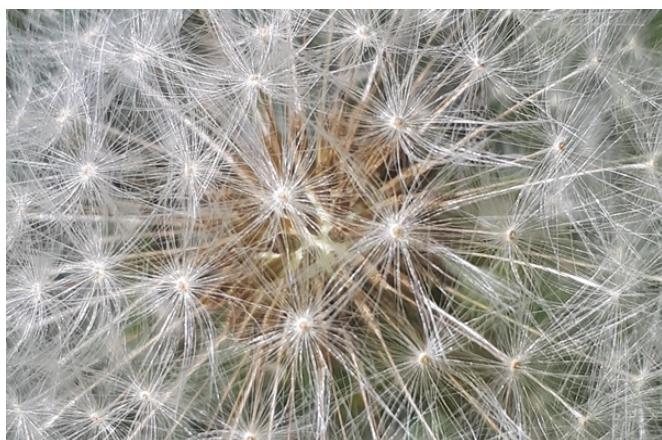
Aigrettes d'une fleur de pissenlit

particulière de la famille des Asteaceae , valoriser la forme artistique des aigrettes de la plante, indiquer que les feuilles n'ont plus de valeur gustative à ce stade de développement ou annoncer la propagation des graines par le vent (anémochorie), si négative pour l'entretien d'une pelouse.