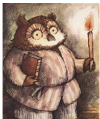
HULUL, le personnage d'Arnold LEBEL

Autrefois il m'arrivait de raconter aux enfants l'histoire d'Hulul, le hibou qui, à l'aise dans son logis confortable, s'apprêtait à déguster son bol de soupe. Et voilà que la tempête de neige s'en donne à cœur joie dehors. Dehors c'est dehors.