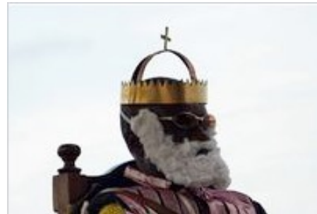
São Tomé and Príncipe