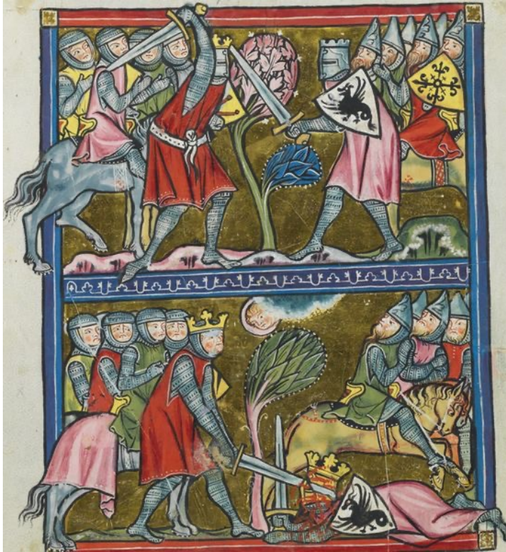
Manuscrit allemand (vers 1300) Karl der Grosse (Der Stricker)