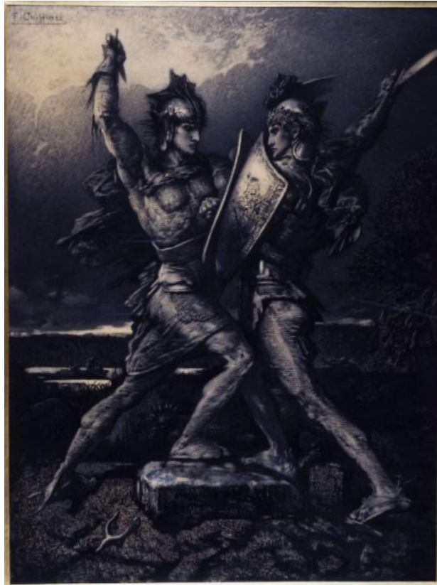
Roland et Olivier Pour Victor Hugo