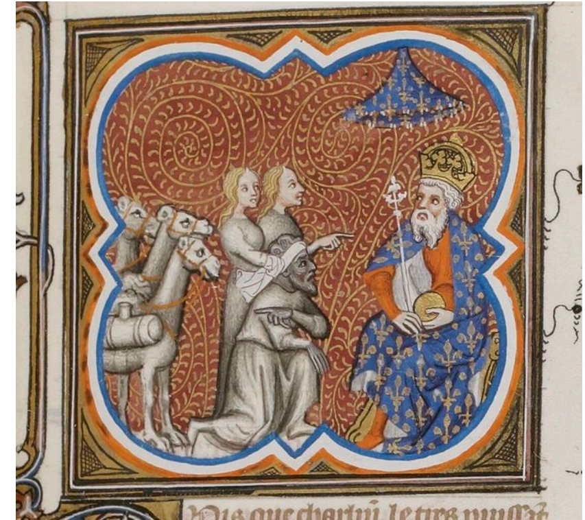
Grandes chroniques de France 1375