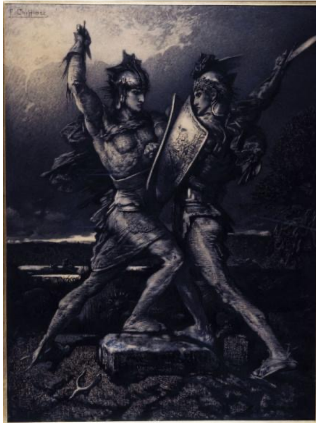
Roland et Olivier Pour Victor Hugo