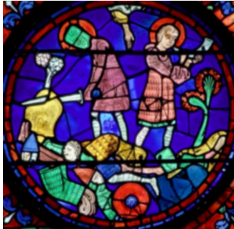
Chartres, vers 1225