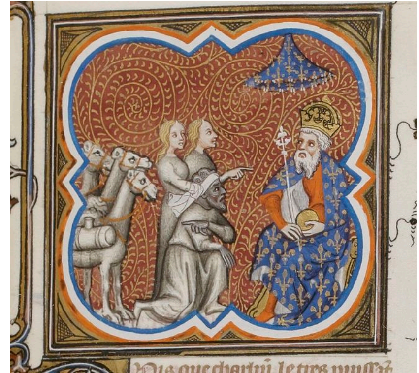
Grandes chroniques de France 1375