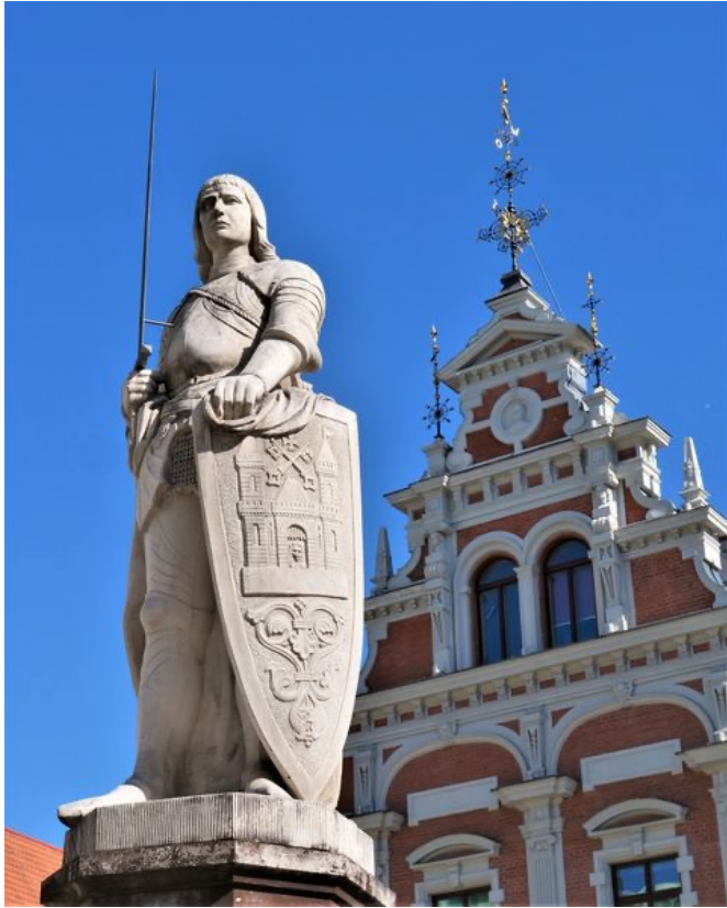
Roland à Riga